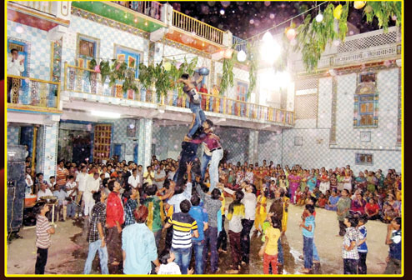
શ્રી કૃષ્ણ જન્માષ્ટમીની મહાઆરતી બાદ મટકી ફોડતા ભક્તજનો - અંજાર