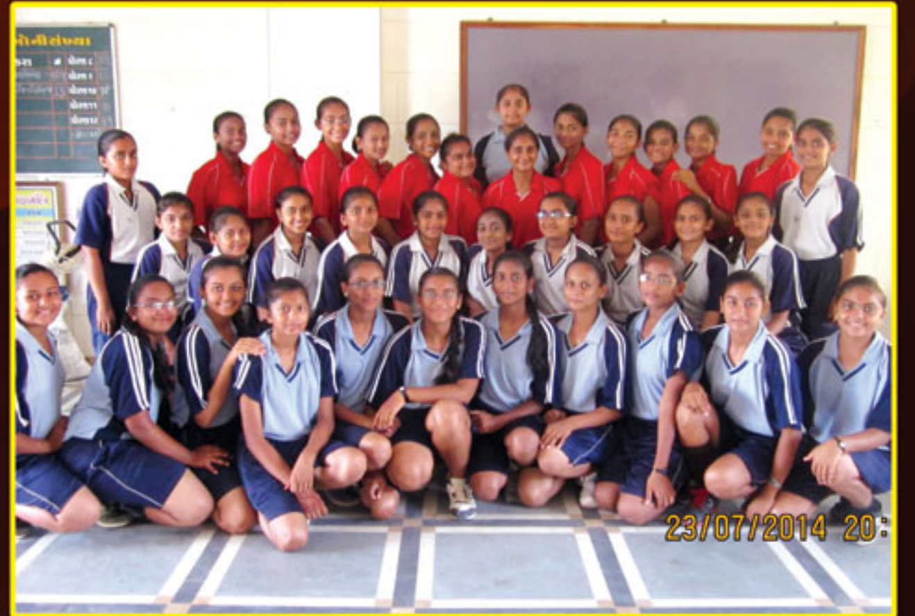
જિદ્દા કક્ષાએ શ્રો બોલમાં ચેમ્પીયન થયેલ તેમજ યોગાસન સ્પર્ધામાં વિજેતા થયેલ કન્યા વિદ્યામંદિરની વિદ્યાર્થીનીઓ - ભુજ