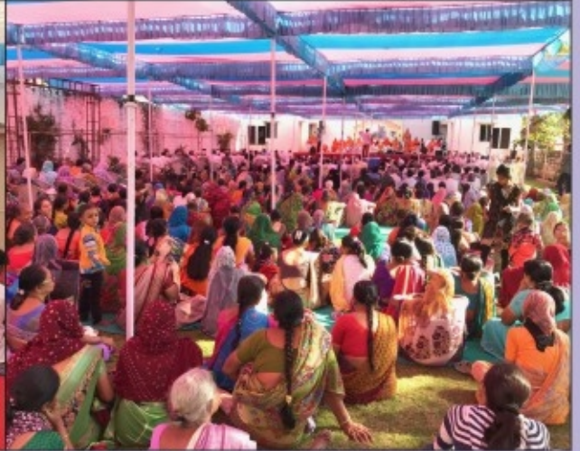
૧. વીસનગર શાકોત્સવ પ્રસંગે વિશાળ સભામાં દર્શન આપતા પ.પૂ. આચાર્ય મારાજશ્રી તથા સભાને સંબોધતા પૂ. પી. પી. સ્વામી (જેતલપુર) ૨. સલઈ ગામે શાકોત્સવ પ્રસંગે સભામાં આશીર્વાદ આપતા પ. પૂ. આચાર્ય મહારાજશ્રી તથા સભાને સંબોધતા પૂ. પી. પી. સ્વામી (જેતલપુર). ૩. વડુ શ્રી સ્વામિનારાયણ મંદિરના દેવોના પાટોત્સવ પ્રસંગે સભામાં આશીર્વાદ આપતા પ. પૂ. આચાર્ય મહારાજશ્રી તથા બાળ મંડળ સાથે પ. પૂ. લાલજી મહારાજશ્રી. ૪. મહેસાણામાં શાકોત્સવ પ્રસંગે સભામાં મોટી સંખ્યામાં સંતો તથા હરિભક્તો.