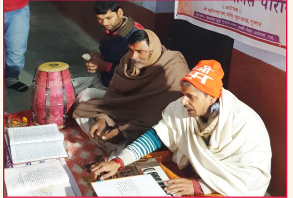
શ્રી રામચરિત્ર માનસ પારાયણ - અયોધ્યા