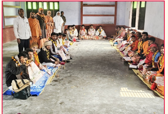
સુંદરકાંડ પારાયણ - અયોધ્યા