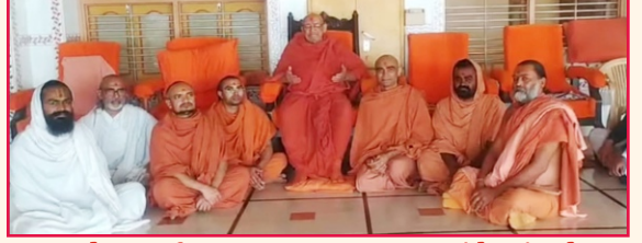
અયોધ્યા શ્રી રામ પ્રાણ પ્રતિષ્ઠા પ્રસંગે ભંડારો લઈને જતા સંતોને આશીર્વાદ સાથે મોકલાવતા સંતો